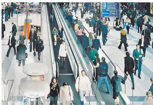
מסוע ההליכה Innotrack של KONE