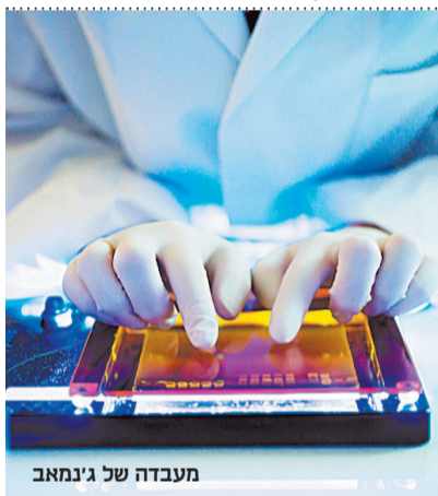
צילום: Marieke de Lorijn