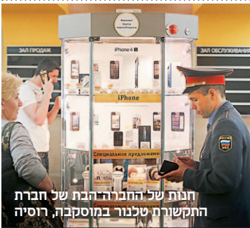
נחות של החברה הבת של חברת התקשורת טלנור במוסקבה, רוסיה