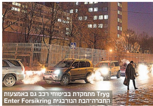
Tryg מתמקדת בביטוחי רכב גם באמצעות החברה הנורבגית Enter Forsikring

ל-Tryg שווי שוק של 3.5 מיליארד דולר ומכפיל רווח של 19.20 לעומת מכפיל ענפי ממוצע של 20.60. הכותבים הם מנכ"לים משותפים באביב-שגב ניהול השקעות