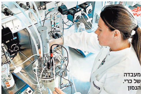
מעבדה של כרי.הנסן תחזית

רי.הנסן (Chr.Hansen) הדנית שולטת על נתח של 45% מתוך שוק התוספים לשוק הגבינות העולמי. כך כל גבינה שנייה שנמכרת בעולם מכילה את האנזימים או התרכיבות של החברה. החברה הוקמה ב־1874 כשהרוקח הדני כריסטיאן הנסן הקים את המפעל הראשון לייצור אנזימים לתעשיית הגבינות. כיום הנסן עוסקת בפיתוח, ייצור ומכירת מרכיבים טבעיים לרבות אנזימים, תוספי מזון וצבעי מאכל המשמשים בתעשיית המזון, התרופות והחקלאות. החברה מעסיקה כ־2,570 עובדים ביותר מ־30 מדינות ברחבי העולם. שווי השוק שלה עומד על 7.4 מיליארד יורו.