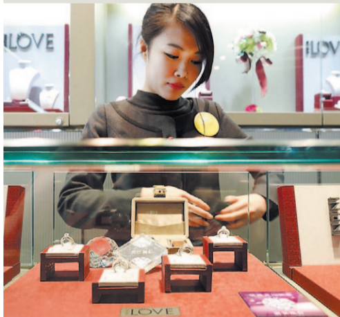
רובע התכשיטים הבינלאומי בסין

של 2013 ניתן לזקוף לגידול בפעילות ובהכנסות באירופה, שעלו ב-50.4% לעומת הרבעון המקביל אשתקד. גם בארה"ב ובקנדה חל שיפור משמעותי (38%) וכך גם במדינות אסיה פסיפיק (26.1%). אך פנדורה לא עוצרת שם, וציינה ברו"חות המסכמים של 2012, כי ככוונתה לפתוח במהלך 2013 עוד כ-150 חנויות קונספט ולהעמיק את פעילותה באיטליה, רוסיה, צרפת